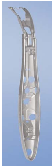
Funktionselement für Duschpaneel