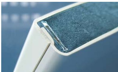
Thermoforming mit PUR-Schaumtechnik

Das Leistungsspektrum der DUROtherm umfasst die gesamte Prozesskette eines modernen Thermoformers: Ob Beratung, Entwicklung und Konstruktion, Prototyping, Serienfertigung, oder Logistik – alle Leistungen stehen aus einer Hand zur Verfügung. Dabei sind fundiertes Know-how sowie stetige Investitionen in den hochmodernen Maschinenpark ausschlaggebend für die technologische Vorreiterrolle der DUROtherm.