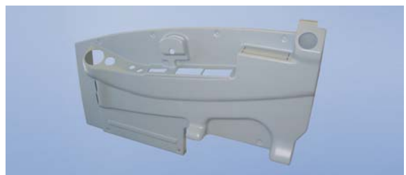
Seitenverkleidung für Fahrerkabine in Baufahrzeug