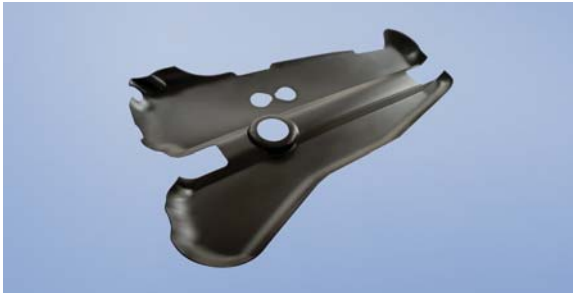
Feuerschutzabdeckung für Kraftstofftank