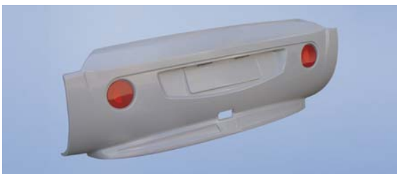
Heck-Leuchenträger für Wohnmobil