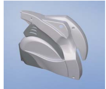
Seitenverkleidung für Fitnessgerät