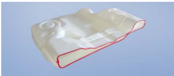
Tank in Twin-Sheet-Technik (Querschnitt)