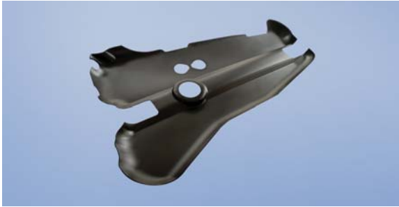
Protipožární kryt pro nádrž na pohonné hmoty