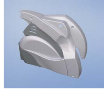
Postranní kryt fitnessového stroje