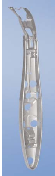
Funkční prvek ve sprchovém panelu