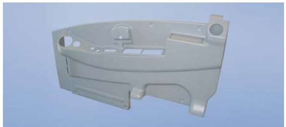
Boční zakrytí kabiny řidiče ve stavebním vozidle