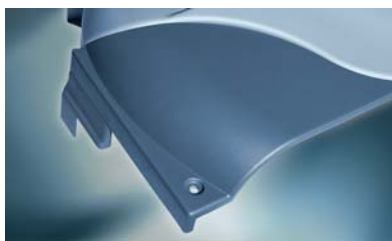
Tvarování za tepla Single-Sheet