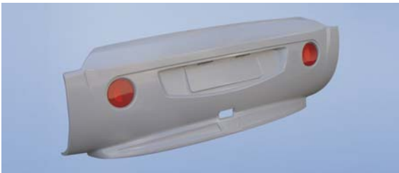
Držák zadního světla obytného automobilu