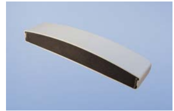
Sklopné sedátko vypěněné polyuretanem (řez)